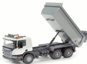
Scania Tippbil 132,-