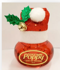
Poppy Jul 152,-