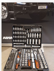
Kamasa hylsnyckelsats 1.199,-