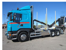
Åbergs Åkeri AB Scania R 560 LB 6x4