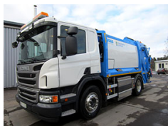
Oskarshamns kommun 2-axlig sopbil med gasdrift