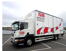
Isoleringspecialisten AB Scania P 230 DB 4x2