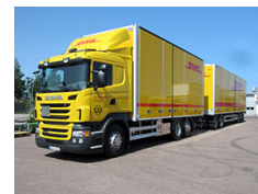
EB Logistik AB Komplett ekipage Scania R 440 LB 6x2*4 med 2-pedals Opticruise och ett nytt släp från Närke