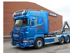
M Danielsson Åkeri AB Scania R 560 LB 8x4*4 HNB Lastväxlare från Hejca AB