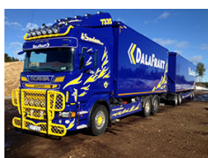
I Sundgrens Åkeri AB Scania ARB 560 LB 6x2 MNB Flisbyggnation från Eksjö M&T