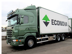
Ekonova AB Scania R 560 LB 6x4