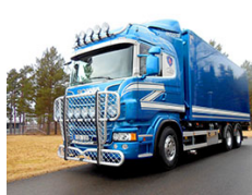
S Granflo Åkeri AB Scania R 560 LB 6x4 MNB Flisbyggnation från Eksjö M&T